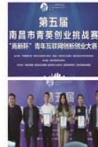
期待他们在下一轮比赛中的精彩表现!

第五届南昌市青英创业挑战赛暨高新杯青年互联网创新创业大赛社会组首场高校组比赛于10月20、21日在慧谷创意产业园举行。