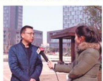
园区工作人员介绍了慧谷产业园整体运营情况:园区占地260亩,规划总建筑面积30万㎡,目前已完成一、二期共计20余万㎡建设,目前已获得“国家级众创空间”、“省知识产权(专利)孵化中心”、“全省众创示范基地”、“江西省服务外包示范园区”、“南昌市电子商务示范基地”、“洪城众创3.0”等荣誉称号。

12月16日上午,慧谷产业园开展“慧谷·创业正当时”媒体开放日活动,南昌电视台、江西日报、南昌日报、信息日报、江南都市报等多家媒体记者走进慧谷产业园,了解园区首期味粽创客空间、留创园的运营成果,并现场参观园区二期项目建设情况。